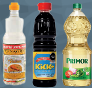
VINAGRE / SILLAO ACEITE