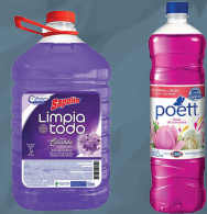
PRODUCTOS DE LIMPIEZA