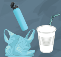
OBJETOS DE PLÁSTICO