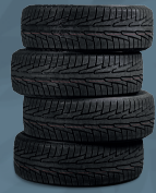
JEBES O CAUCHO