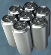
LATA DE ALUMINIO