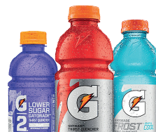
Botellas Energizantes o Rehidratantes (sin etiqueta)